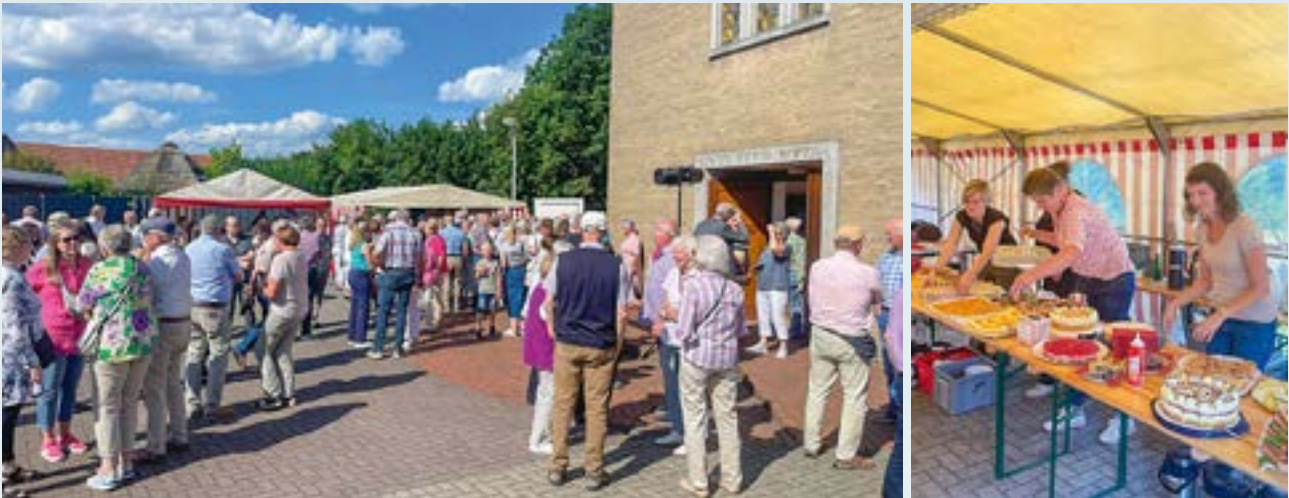
Zeit für Gespräche und etwas Kuchen gab es auch noch nach der Kirchenführung. Bei bestem Wetter wurde die „Kirche des Monats“ in Estringen zu einem vollen Erfolg.

Am Sonntag, den 11. August 2024, öffnete die Kapelle St. Antonius Einsiedler in Lingen-Estringen ihre Türen als „Kirche des Monats“. Zahlreiche Interessierte aus dem Emsland und darüber hinaus nutzten die Gelegenheit, das 1520 erbaute Gotteshaus und seine bewegte Geschichte zu entdecken.