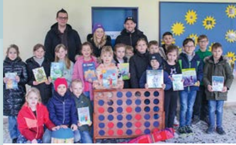
Team übergibt Spenden an die Grundschule und die Kita in Bramsche

Gerne blicken wir auf gelungene Taizé-Andachten in der Fastenzeit zurück! Der Altarraum war so stimmungsvoll mit orangefarbenen Tüchern und vielen Kerzen hergerichtet, dass es uns selbst begeistert hat! Wir durften uns über viel positives Feedback freuen! Deshalb haben wir es im Advent nochmal angeboten. Immer nach dem Motto: Du bist herzlich eingeladen! Mach Dich auf! Komm zur Ruhe! Lass Dich beseelen! Gönn Dir die halbe Stunde nur für Dich! Wir wollen Dich mitnehmen in die Oase der Ruhe! Wir freuen uns auf Dich!