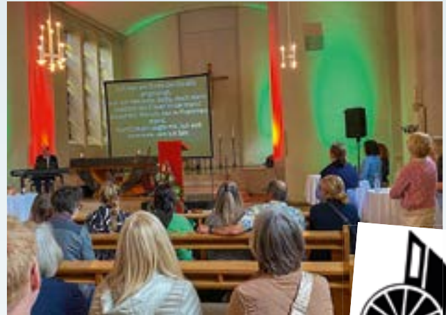
Das linke Bild zeigt die Schülerinnen und Schüler, welche an der Kunstausstellung beteiligt waren. Das rechte Bild zeigt die Veranstaltung „Come together, sing together“.