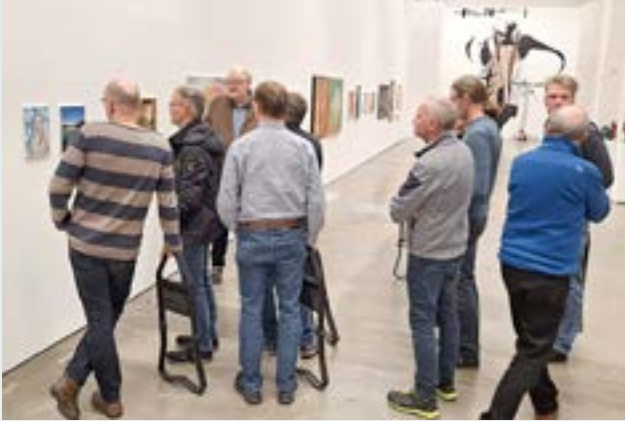
Das Foto entstand beim Besuch der Ausstellung „Kunst von hier“ in der Kunsthalle Lingen im Februar.