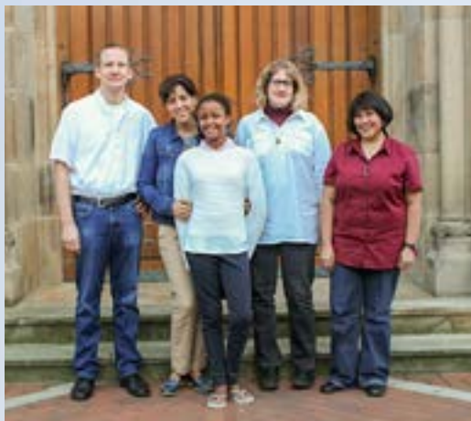
Das Bild zeigt die Mitglieder der Gemeinschaft Verbum Dei zur Eröffnung in Lingen 2014.

Am 19. September dieses Jahres wurde ich von den Teilnehmern unseres alle sechs Jahre stattfindenden Kongresses zur Präsidentin der Verbum-Dei-Familie gewählt. Diese neue Aufgabe bedeutet für mich, nach Rom zu ziehen, wo meine Hauptaufgabe darin besteht, die Zusammenarbeit und Konsolidierung der verschiedenen Gruppen zu fördern, die die Verbum-Dei-Familie ausmachen: geweihte Männer und Frauen, Priester, Ehepaare, geweihte Laien und Mitarbeitende. Am meisten begeistert mich die Möglichkeit, neue Herausforderungen anzugehen und die Fähigkeiten und Erfahrungen, die ich in Lingen gesammelt habe, in einem anderen Umfeld einzubringen. Besonders freue ich mich darauf, meine Gemeinschaft und auch der Kirche auf einer viel breiteren Ebene kennenzulernen, da meine Aufgabe auch Besuche in Verbum-Dei-Gemeinschaften in verschiedenen Teilen der Welt umfasst.